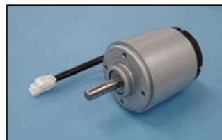
重さ/Weight :540g (Approx.)