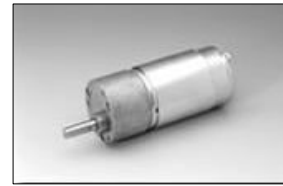
重さ/Weight :300g (Approx.)