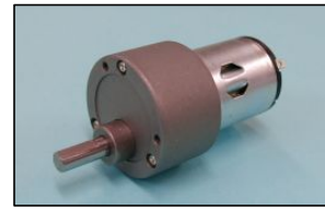
重さ/Weight :130g (Approx.)