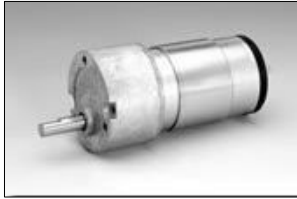
重さ/Weight :g (Approx.)