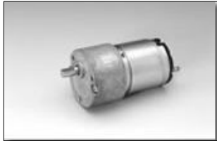
重さ/Weight :105g (Approx.)