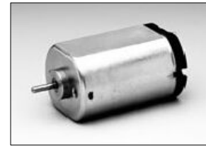
重さ/Weight :58g (Approx.)

用途例/Application example ヒートバルブ / Heat valve